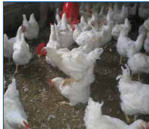
Figura 1: Acasalamento de uma fêmea totalmente empenada e um macho com esporão intacto, mostrando a ausência de sinais de danos no quarto traseiro da fêmea. Lesões cutâneas e/ou os danos às penas podem ocorrer devido a disputas por dominância ou pela ração (tanto entre machos

Embora o tratamento do esporão tenha sido introduzido inicialmente como uma forma de reduzir o impacto das lesões cutâneas e os danos causados às penas, é importante frisar que a eliminação do esporão não impede sua ocorrência. O empenamento desempenha um papel fundamental na proteção das aves contra lesões, e através do bom empenamento, qualquer dano observado pode ser eliminado ou reduzido consideravelmente ( Figura 1 ). Se os machos tiverem comportamento muito agressivo durante as fases iniciais após o acasalamento, podendo causar danos às penas das fêmeas, será necessário rever a sincronização sexual, os procedimentos de acasalamento e as taxas de acasalamento.